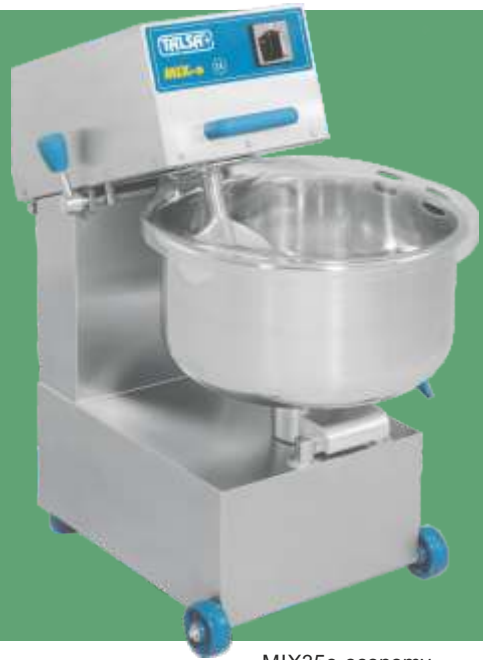
MIX35e-economy, 1 motor (blade)