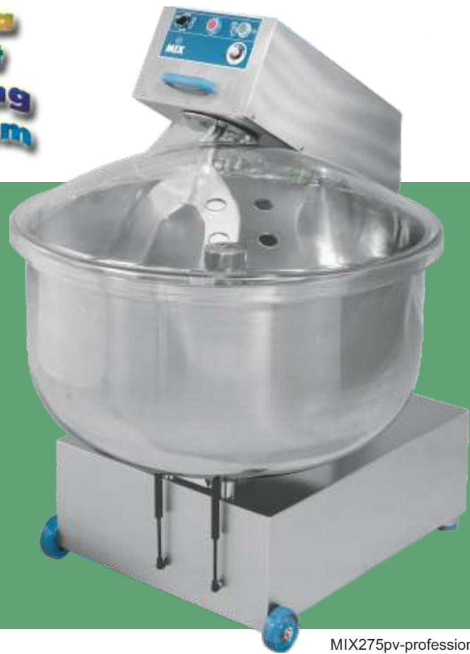
MIX275pv-professional, 2 motors, optional V-electronic variable blade speed

MIXERS MENGER PÉTRINS MÉLANGEURS MENGMACHINES MIXERE IMPASTATRICI AMASADORAS MEZCLADORAS MIX35E•MIX35P MIX60E•MIX60P MIX80E•MIX80P MIX100E•MIX100P MIX150P•MIX200P M I X 2 7 5 P