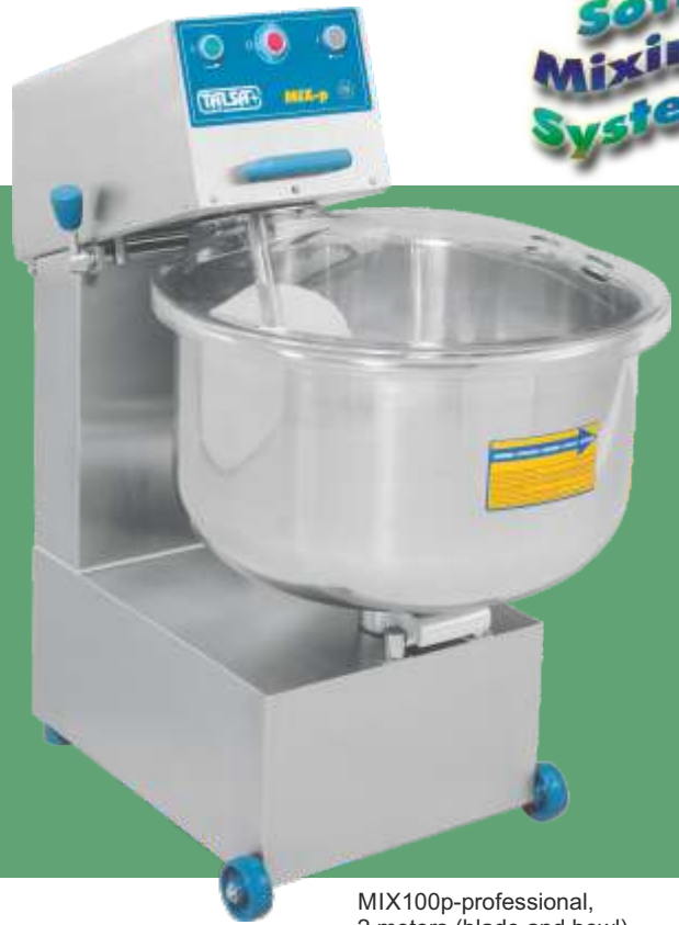
MIX100p-professional, 2 motors (blade and bowl)