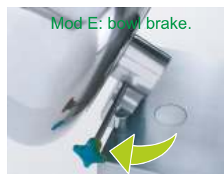
Mod E: bowl brake.

MIXERS MENGER PÉTRINS MÉLANGEURS MENGMACHINES MIXERE IMPASTATRICI AMASADORAS MEZCLADORAS MIX35E•MIX35P MIX60E•MIX60P MIX80E•MIX80P MIX100E•MIX100P MIX150P•MIX200P M I X 2 7 5 P